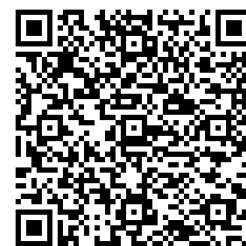
線上報名系統 QR Code

請先至國立臺中教育大學線上報名系統( https://tinyurl.com/2blqojw7 )報名，網路報名程序完成後，待報名人數達 50 人，本機構會進行可上課人數調查，若可上課人數達 30 人，即開始規劃開課，課表排定，會郵寄完成報名手續通知至學員電子信箱(同時簡訊通知)，屆時請依表 1 完成報名手續，繳款完成，請將繳款證明文件，連同填寫完成的簡章報名表，掃描 mail 至 gientcu@gmail.com，方為完成報名手續(詳如下表 1)。報到當天請學員攜帶身分證(或證明證件)以利查驗。